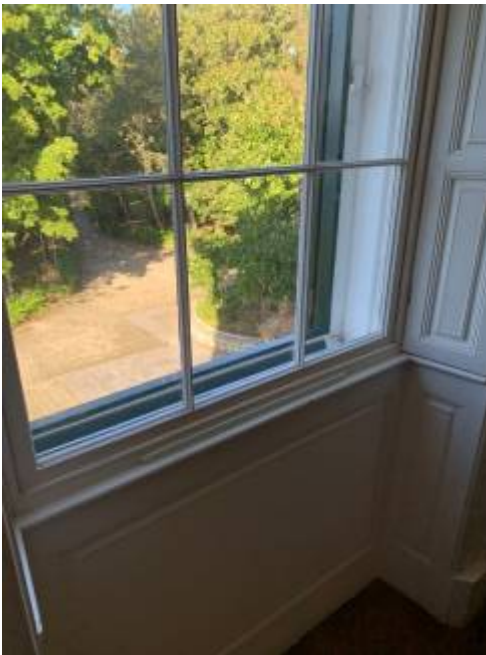
Εσώφυλλο παραθύρου 1 ου ορόφου