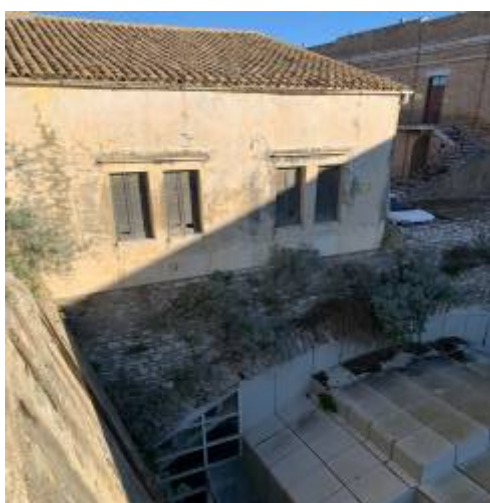
Παράθυρα νότιας όψης Λατινικού παρεκκλησίου

Το πλαίσιο (κάσωμα) του παραθύρου θα είναι 4-5 εκ.