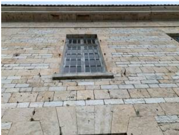
Παράθυρα επάνω επιπέδου

Θα επισκευαστεί και θα τριφτεί - χρωματιστεί το πλαίσιο του παραθύρου βιτρώ διαστάσεων 3,30 μ. (πλάτος) x 6,00 μ. (ύψος)