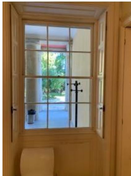
Παράθυνα ισογείου με εσωτερικά φύλλα σκίασης και μηχανισμό