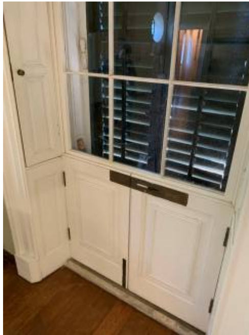
Εσώφυλλο εξωστόθυνας 1 ου ορόφου