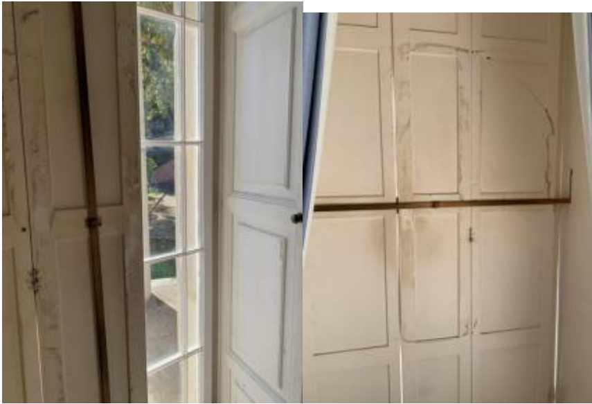
Εσωτερικό φύλλο σκίασης εξωστόθυνας με μηχανισμό