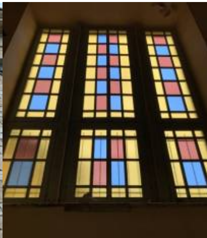
Πλαίσιο - Παράθυρο βιτρώ