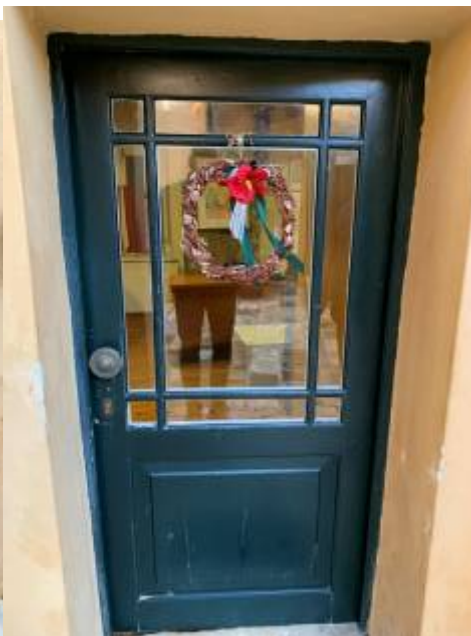
Θύρα 6 (WC)