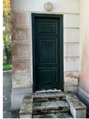
Εξώθυρα 2 η