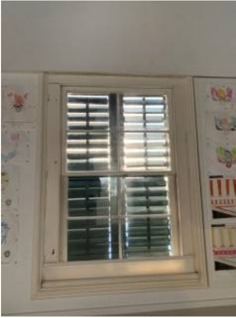
Εσώφυλλο παραθύρου 2 ου ορόφου