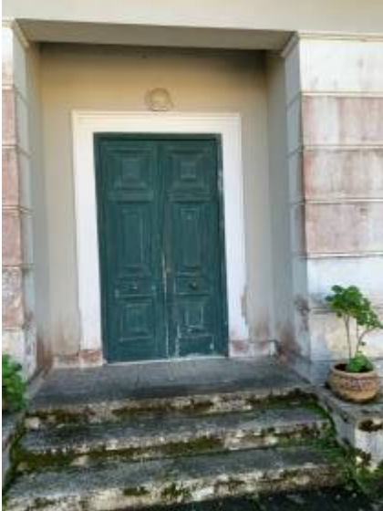
Εξώθυρα 1 η

Επισκευή και χρωματισμός 3 παραθύρων (εσώφυλλα) και 2 εξώθυρων συμπεριλαμβανόμενων των πλαισίων (κάσωμα) τους.