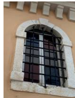
Παράθυρο ναούβοθητικού κτηρίου

Όλες οι ανωτέρω περιγραφόμενες εργασίες θα εκτελούνται σύμφωνα με τις υποδείξεις της Εφορείας Αρχαιοτήτων Κέρκυρας. Ο ανάδοχος υποχρεούται στην αποδοχή συστάσεων και υποδείξεων από την Εφορεία Αρχαιοτήτων Κέρκυρας.