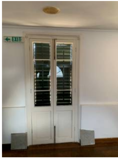
Εσώφυλλο εξωστόθυνας 2 ου ορόφου